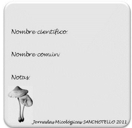
Fichas Identificación de Setas

participó a lo largo de toda la jornada.