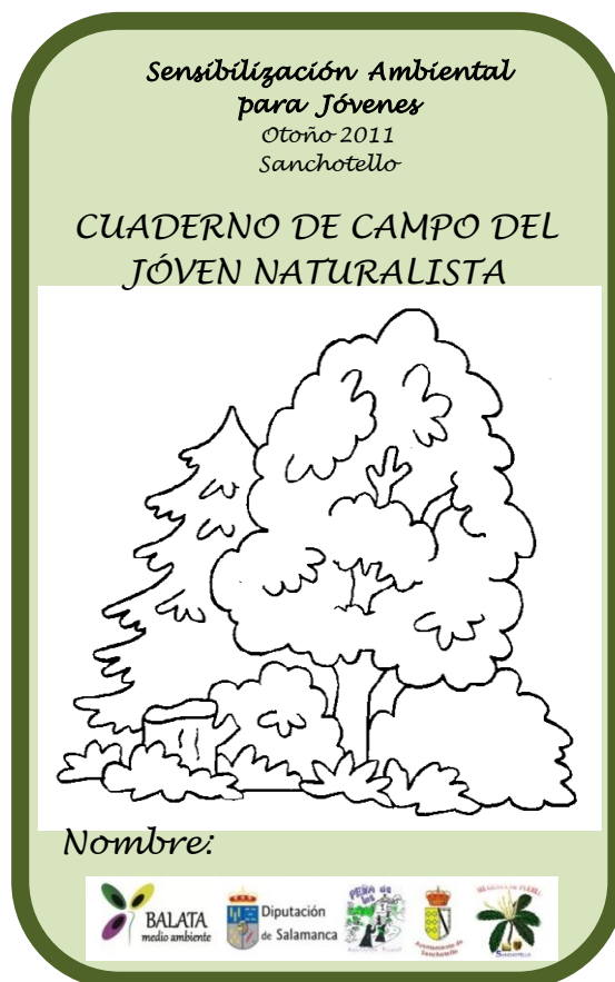
Portada Cuaderno de Campo del Joven naturalista de Sanchotello